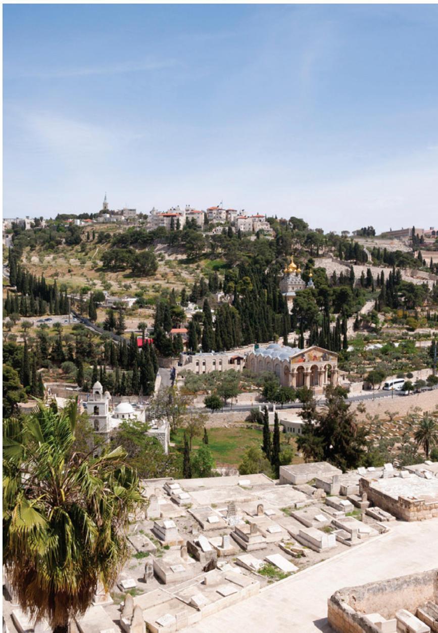
Uitzicht over de Kidronvallei in de richting van de Olijfberg