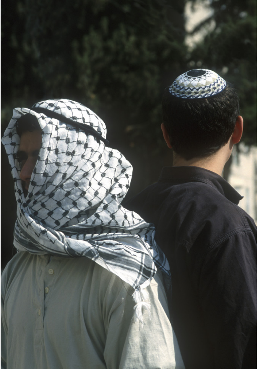
De rivaliteit tussen Abrahams neven zal blijven tot het einde van dit tijdperk.