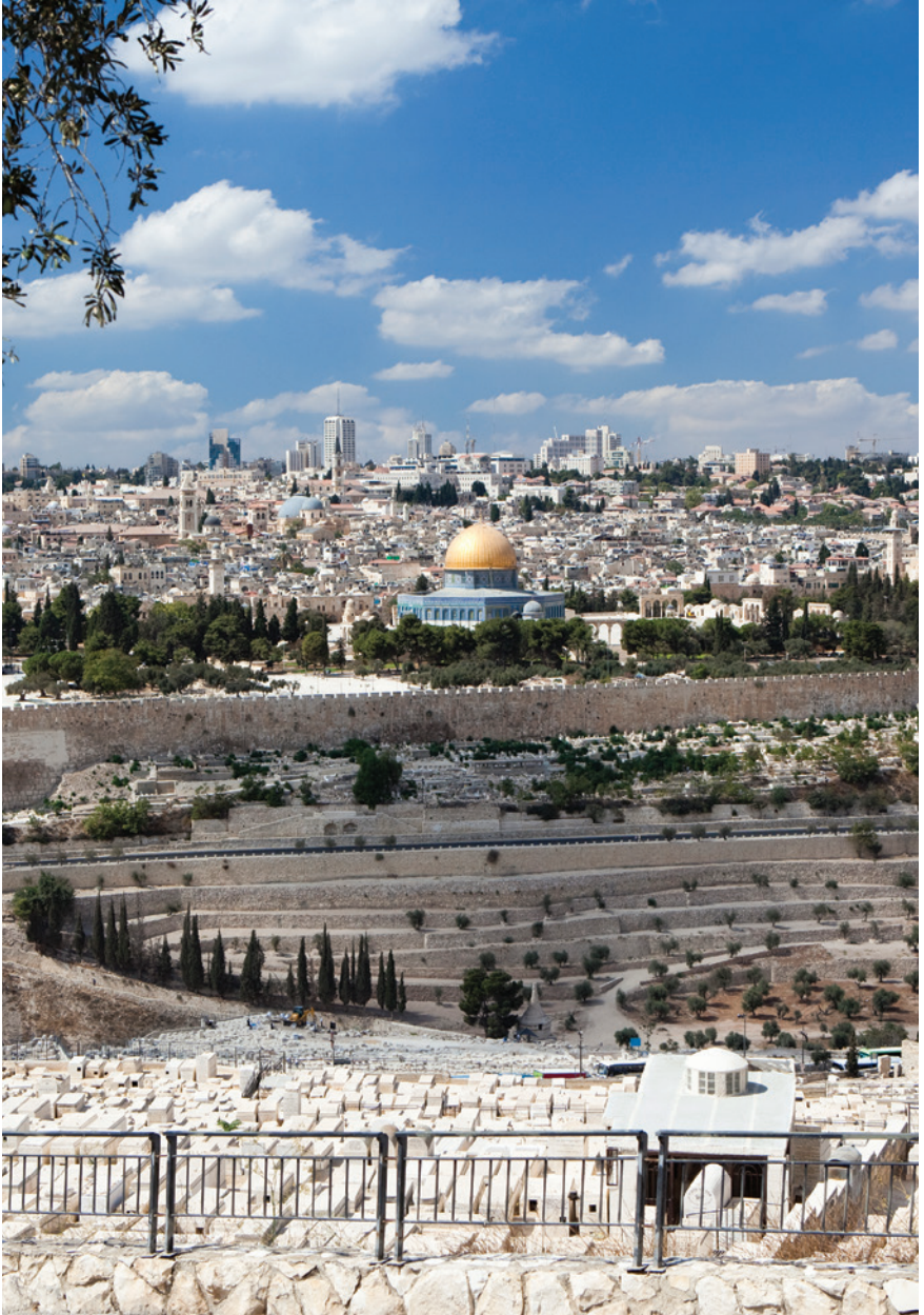
Uitzicht op de Tempelberg en de oude stad Jeruzalem, met het moderne Jeruzalem op de achtergrond