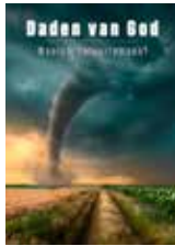
Daden van God

De volgende boekjes kunnen u helpen een beter begrip te krijgen van Gods plannen voor u en de wereld.