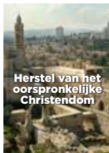
Herstel van het oorspronkelijke Christendom