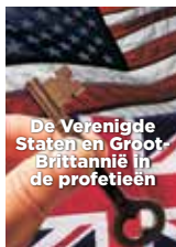
De Verenigde Staten en Groot-Brittannië in de profetieën

U kunt alle literatuur online bestellen via WereldvanMorgen.nl