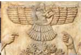
De Hettitische tweekoppige adelaar op het reliëf links en de Assyrische god Ashur afgebeeld op de gevleugelde zonneschijf rechts nodigen tot vergelijking met de tweekoppige adelaar van het Heilige Roomse Rijk en de schijf met adelaar en swastika van nazi-Duitsland.