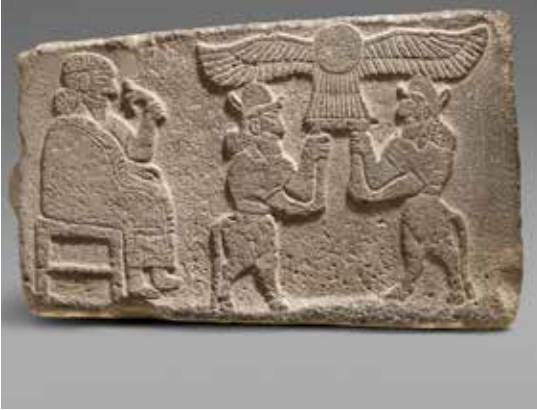
Oud Babylonisch en Assyrisch basreliëf in het British Museum, van koning Assurnasirpals Nimrod Paleis.