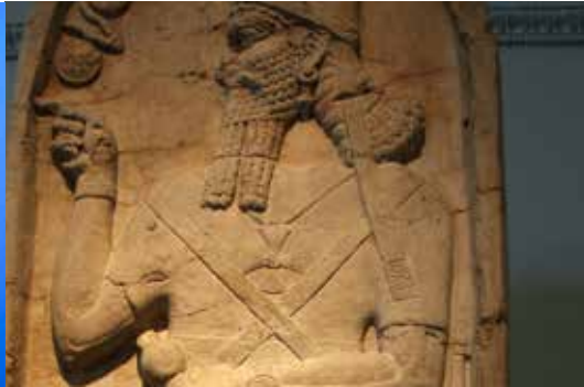
Het ijzeren kruis, gebruikt als militaire onderscheiding door koning Frederik Wilhelm III en door het keizerlijke Duitsland en door nazi-Duitsland, en rechts ook te zien om de nek van de Assyrische koning Shamshi-Adad V op een basreliëf uit de 9e eeuw v.Chr.