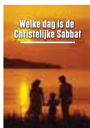
Is dit de enige dag van behoud?