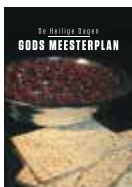
De Heilige Dagen: Gods meesterplan

De volgende boekjes kunnen u helpen een beter begrip te krijgen van Gods plannen voor u en de wereld.